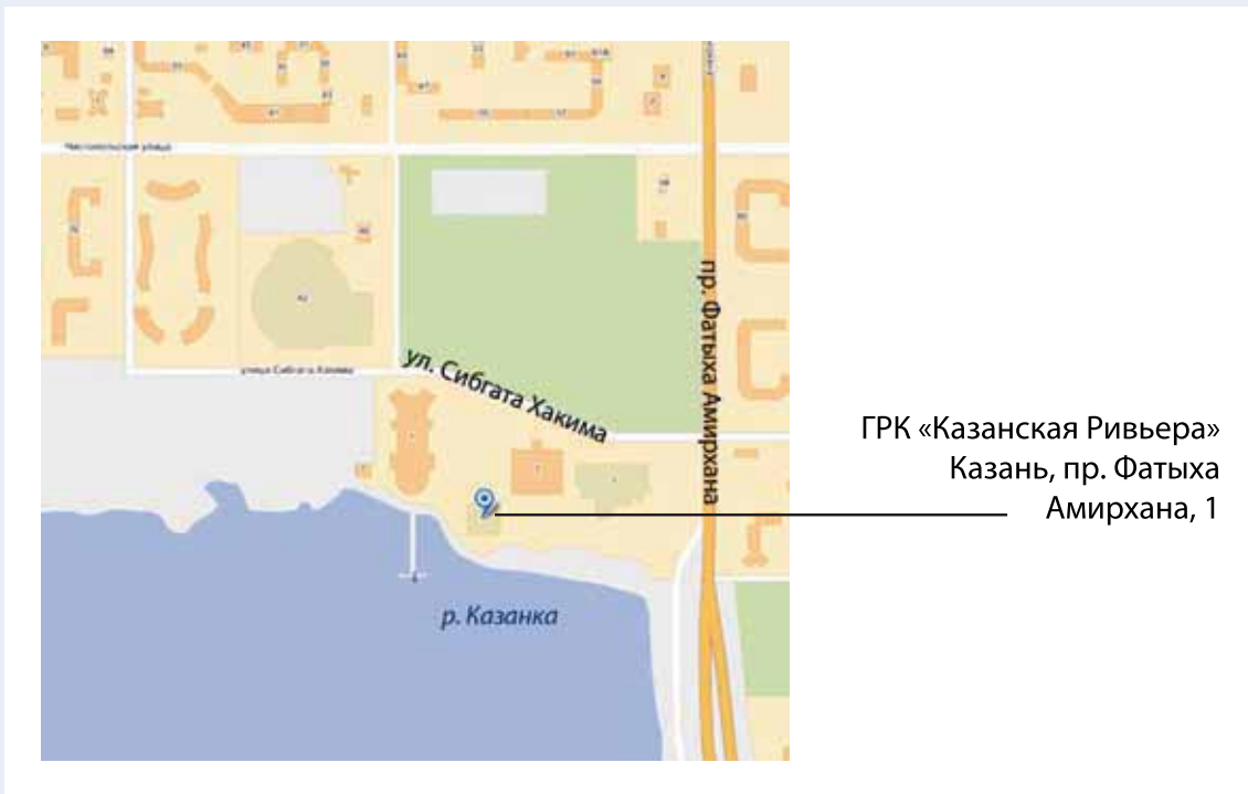
Схема расположения залов заседаний II Конференции дерматовенерологов и косметологов Приволжского федерального округа